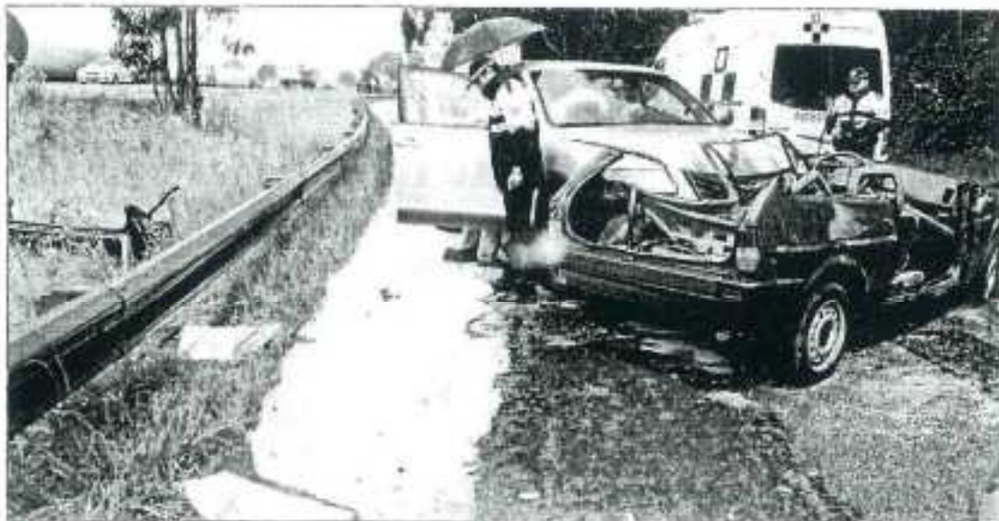
Agentes de la Policía Local inspeccionan el estado en que quedaron los vehículos tras la colisión.