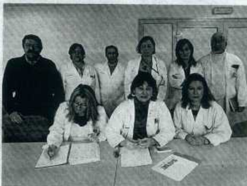
Los miembros de la junta de personal, ayer en el Hospital San Agustín.

En embargo, la Junta de Personal cuestiona ayer esos argumentos, acusando a la dirección de equitarse los derechos de los trabajadores y de reducir de la capacidad de la bolsa de empleo, donde todo el personal inscrito lleva años trabajando en Avilés y conoce perfectamente el Hospital San Agustín. Los sindicatos aseguran que la dirección también apela al desconocimiento del nuevo sistema informático Selene por parte del perso-