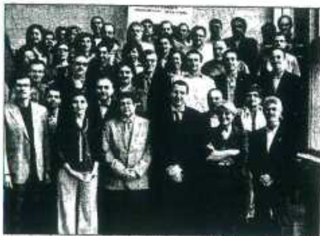
REUNIÓN. Todos los asistentes a las jornadas de Deporte y Salud.

vez en Andalucía (las dos primeras fueron en el Principado de Asturias). Posteriormente, se realizó la reunión de coordinación del 'Grupo de Avilés', en el que están integrados los Centros de Medicina del Deporte de toda España y de Andalucía, además de los centros dependientes de los Ayuntamientos de Granada, Dos Hermanas y Lope.