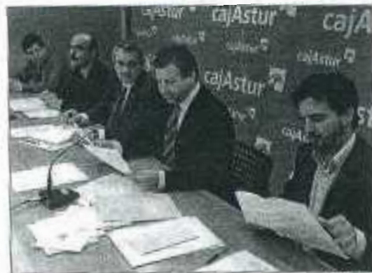
Los componentes del jurado, ayer, antes de hacer público el ganador.

Baskonia y Real Madrid se miden hoy en la segunda semifinal de Copa tras superar ayer, respectivamente, al Bilbao (75-62) y Joventut (90-82). Antes se enfrentarán Valencia y Barça.