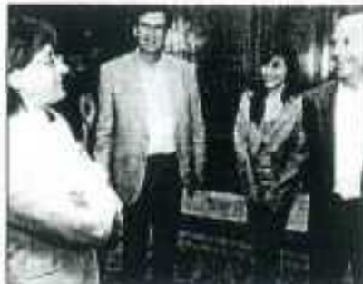
Los médicos planteados, con la Alcaldesa, ayer.

Que en 2007 se hubieran destinado 446.000 euros a mobiliario es inaceptable. «Yo entonces se hablaba de que empezábamos a entrar la crisis los españoles. Al final, gastarse 775 euros en una silla es una ofensa a la situación en que vivían los avilesinos». La diputada recordó que también los gastos de protocolo se duplicaron de 2005 a 2008. «La suma de derroches de las administraciones socialistas nos ha llevado a la situación en la que estamos».