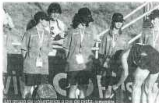
Un grupo de voluntarios a pie de pista. © MARIANA

A. W. Más de un centenar de personas invierten la jornada completa como apoyo fundamental en los distintos aspectos de la organización. Jóvenes y adultos, deportistas de algunos clubes locales, como los de atletismo o el Beñatzen Rugby Club, han pasado su colaboración desinteresada y por ello tienen el agradecimiento general.