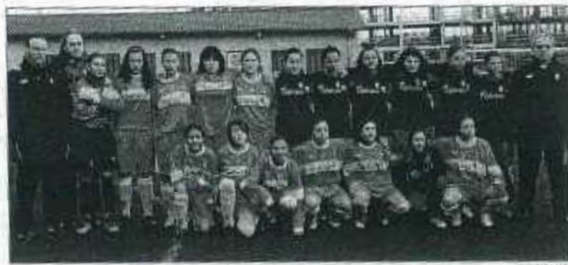
La selección cadete femenina de Asturias, ayer, antes de enfrentarse a la de Madrid en Rocas.