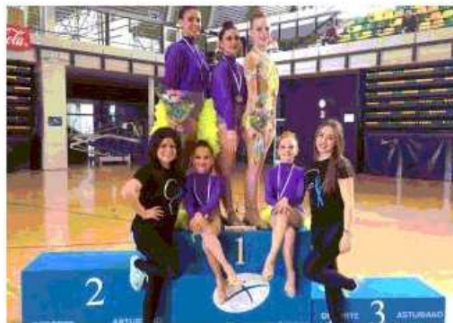
Las deportistas del Rítmica Ares, junto a sus entrenadoras, durante el torneo.

El torneo organizado por el club Rítmica Ares, el pasado 1 de abril, contó con una gran acogida dentro del mundo de la gimnasia rítmica. El polideportivo Juan Carlos Beiro de Langreo acogió a un gran número de deportistas. Un total de 20 clubes, llegados desde distintos puntos de Asturias y de otras comunidades autónomas como Madrid, se dieron cita para ofrecer un gran espectáculo en las categorías prebenjamín, alevín, cadete y juvenil. Además, el evento contó con distintas exhibiciones a cargo de las gimnastas del conjunto organizador de la prueba.