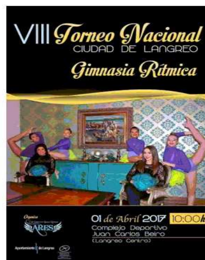
Las gimnastas del Ares, en su cartel promocional.